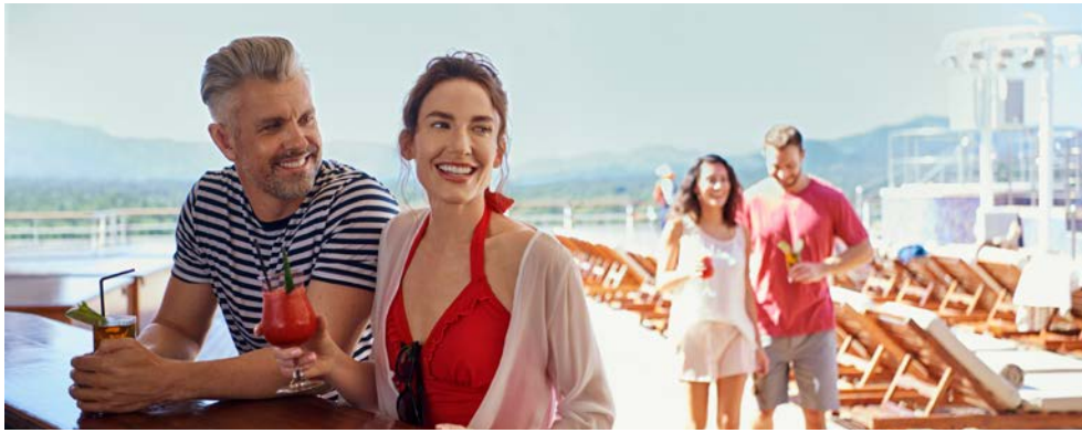
Genießen Sie die Zeit an Bord

Hamburg, das „Tor zur Welt“ an der Elbe, heißt Sie herzlich willkommen zu Ihrer Kreuzfahrt mit der QUEEN VICTORIA. Sie erkunden zunächst das charmante Kopenhagen. Gotland, Schwedens größte Insel, ist dank Sandstränden, Kalksteinklippen und kulinarischer Spezialitäten ein Traumziel in der Ostsee. Auch die quirlige finnische Metropole Helsinki wird Sie begeistern. Höhepunkt ist sicher St. Petersburg – die Stadt strahlt in ihrem Glanz mit der QUEEN VICTORIA um die Wette! Anschließend bewundern Sie in Tallinn die mittelalterliche Altstadt. Erholung an Seetagen geben Ihnen ausreichend Gelegenheit, Ihr wunderbares Schiff zu genießen, bevor Sie zurück in Kiel anlegen.