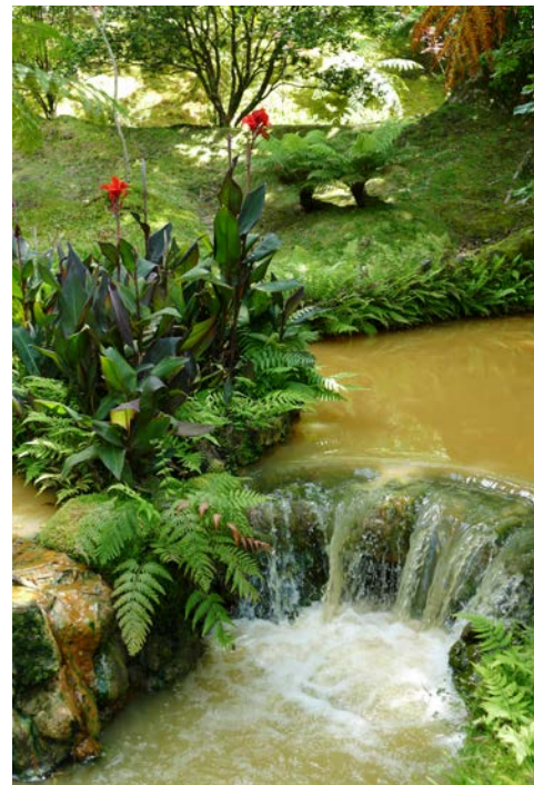
Terra Nostra Park

Fahrt zum Flughafen Ponta Delgada und Rückflug nach Deutschland.