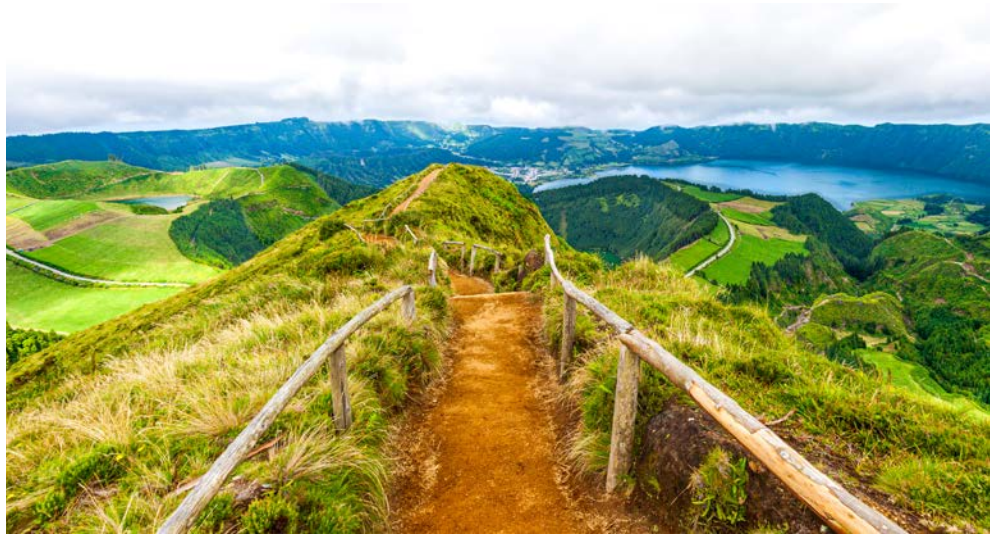
Atemberaubendes Sete Cidades

Facettenreiche Vegetation, faszinierende Kraterseen und eine beeindruckende Tierwelt: Der zu Portugal gehörende Archipel der Azoren ist in jeder Hinsicht einzigartig. Über 1.000 Kilometer vom Kernland entfernt hat sich hier mitten im Atlantik eine einzigartige Flora und Fauna herausgebildet. Besonders auf der Hauptinsel São Miguel, die Sie auf dieser Reise während spannender Ausflüge und Erkundungstouren eingehend entdecken werden, finden sich zahlreiche Naturphänomene. Allen voran die atemberaubende Sete Cidades, die in einem Vulkankrater entstanden und von zwei reizvollen Seen geprägt sind. Auch die Lagoa do Fogo befindet sich im Inneren eines alten Kraters. Überhaupt sind die Azoren vulkanischen Ursprungs. Das macht sich auch in der Region rund um den Ort Furnas bemerkbar. Hier befinden sich verschiedene Thermalquellen und Stellen, an denen Wasserdampf und Gase entweichen. Auch der Terra-Nostra-Park, ein botanischer Garten, mit seinen uralten Bäumen, seltenen Pflanzen und seinem warmen Thermalbad ist in dieser Gegend beheimatet. Die artenreiche Flora ist typisch für die Azoren, bedingt durch das hier vorherrschende feuchte, ozeanisch-subtropische Klima. Dank der Lage im Atlantik gibt es keine Extremtemperaturen, die Winter sind mild und die Sommer angenehm warm. Auf die daher üppig grün bewachsene Landschaft São MIGUELS bieten sich von zahlreichen Aussichtspunkten immer wieder fantastische Ausblicke.