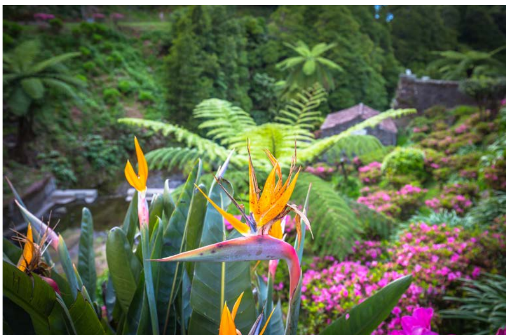
Terra Nostra Park