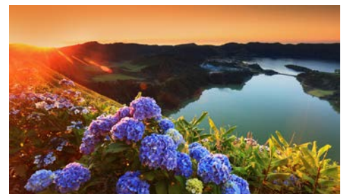
Farbenfrohes São Miguel

Vom Berg Barrosa bietet sich eine herrliche Aussicht über den ruhigen und idyllischen See Lagoa do Fogo. Über die Berge erreichen wir Caldeira Velha. Im Anschluss geht es in das kleine Städtchen Ribeira Grande. Um die zentrale Brücke findet man einen kleinen Park und drum herum gesellen sich Cafés.