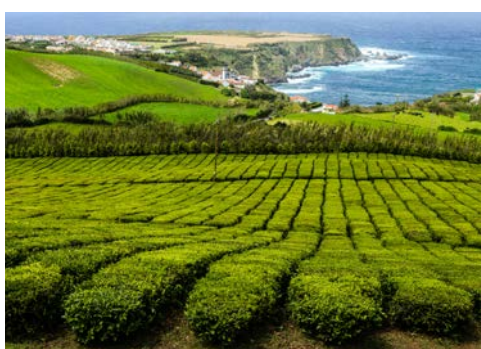
Teeplantage auf São Miguel

Auf dem Programm stehen der Besuch einer traditionellen Keramikfabrik sowie des Museums Casa da Cultura.