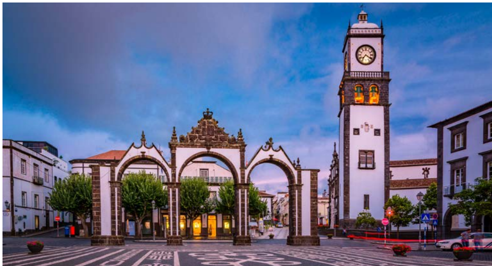
Marktplatz Ponta Delgada