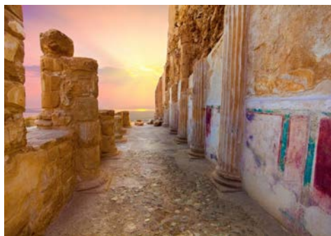
Der Palast des Herodes, Masada

Hinweis zur Barrierefreiheit: Unser Angebot ist für Reisende mit eingeschränkter Mobilität nur bedingt geeignet. Bitte kontaktieren Sie uns bezüglich Ihrer individuellen Bedürfnisse.