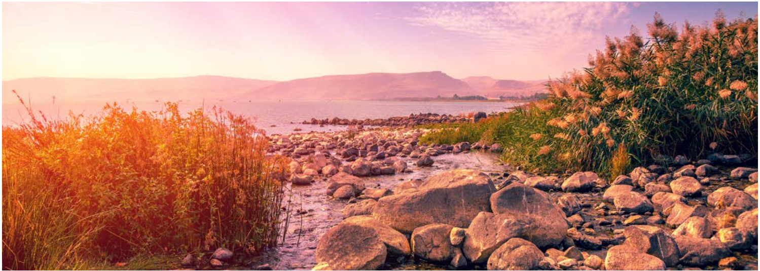
Der See Genezareth