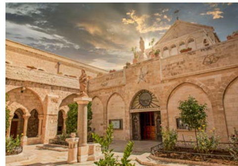
Die Geburtskirche in Bethlehem

Nach dem Frühstück Fahrt nach Abu Gosh, einem der Emmaus-Orte und weiter nach Tel Aviv. Dort fahren Sie durch die moderne Stadt und besuchen den alten Hafen Jaffa. Transfer zum Flughafen und Rückflug nach Deutschland.