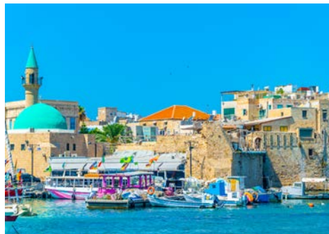
Akko – der alte Hafen

Flug von Deutschland nach Tel Aviv. Am Flughafen werden Sie von Ihrer örtlichen, Deutsch sprechenden Reiseleitung empfangen und zu Ihrem Hotel in Netanya begleitet. Abendessen und Übernachtung im Hotel.