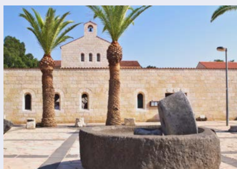
Die Brotvermehrungskirche, Tabgha