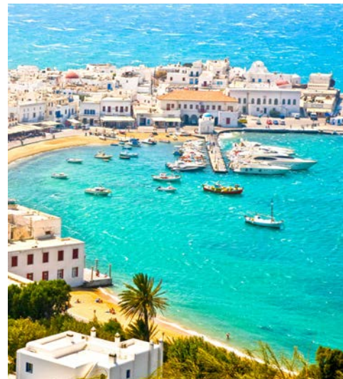
Der Hafen von Mykonos