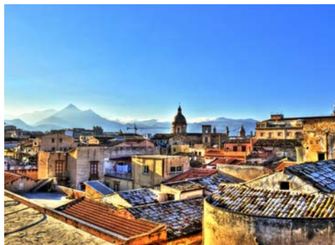
Blick auf Palermo