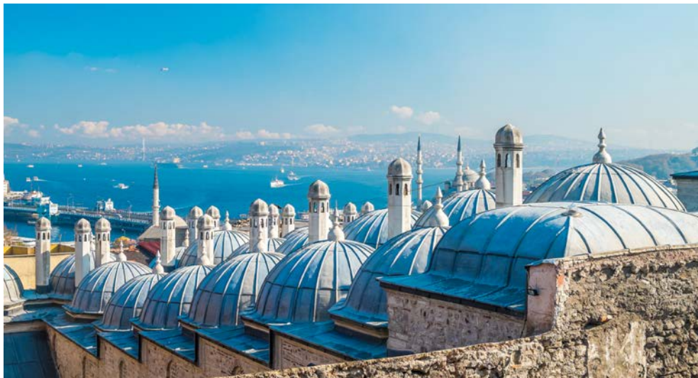
Die Süleymaniye Moschee in Istanbul und Blick auf den Bosphorus im Hintergrund