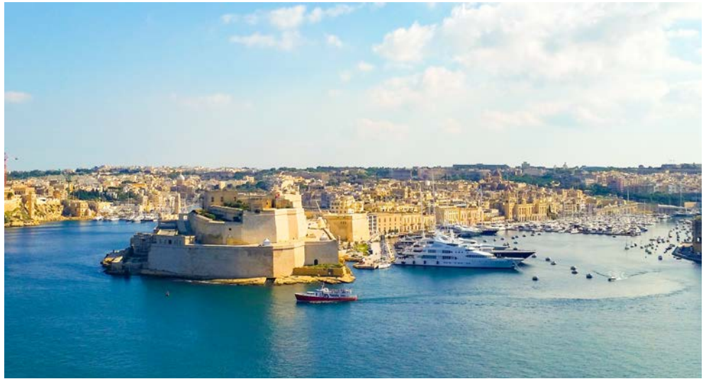
Blick auf den Hafen von Malta

Erleben Sie mit der NORWEGIAN JADE fast jeden Tag einen neuen Hafen auf Ihrer unvergesslichen 9-tägigen Kreuzfahrt quer durchs Mittelmeer. Entdecken Sie die Geheimnisse und Schätze des historischen Palermo, während Sie die Katakomben der Kapuzinerbrüder erkunden, die Meisterwerke im Oratorium des Rosario di San Domenico sehen und wunderschöne Monumente besuchen. Schlendern Sie anschließend durch Santorins schmale Gassen entlang der Häuser mit den berühmten blauen Dächern, ehe Sie ein paar leckere, typisch griechische Spezialitäten genießen. In Istanbul können Sie den farbenfrohen Topkapi-Palast – einst die Residenz der osmanischen Sultane – bestaunen und auf dem belebten Großen Basar einkaufen.