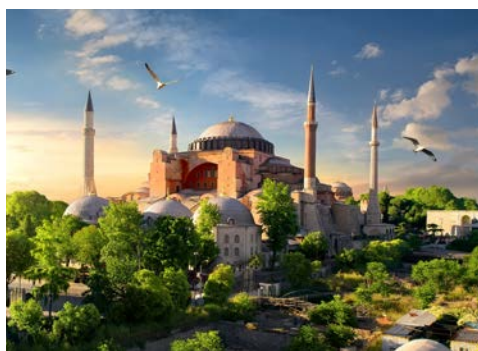
Die Hagia Sophia

Als einzige Stadt der Welt, auf zwei Kontinenten gebaut und an den Ufern zweier Meere gelegen, ist Istanbul eine einmalige Mischung aus Alt und Neu, aus Geschichte und Gegenwart. Die prachtvolle Lage am Bosphorus, die unzähligen Bauten aus byzantinischer und osmanischer Zeit und die bedeutenden Kunstschätze in den Museen, lassen diese Stadt zwischen Abendland und Morgenland zu einem unvergesslichen Abenteuer werden. Freuen Sie sich auf diese atemberaubende Metropole.