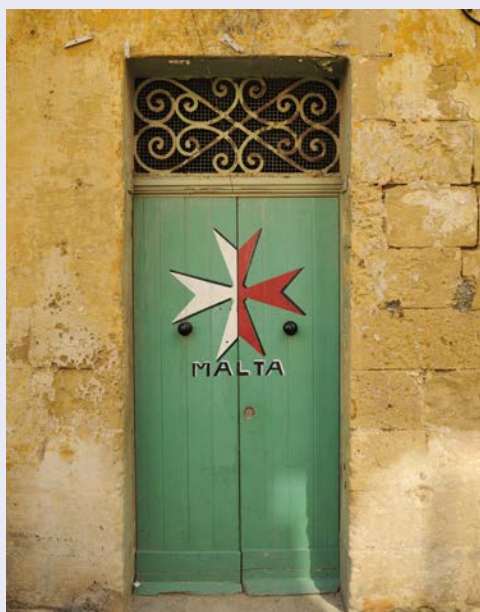
Willkommen auf Malta

Die traumhafte, typisch kykladische Architektur und die einzigartige Geologie haben Santorini zu einem der beliebtesten Urlaubsziele der griechischen Inseln gemacht. Schlendern Sie durch die schmalen Gassen, stöbern Sie in den vielen Kunstgeschäften und lassen Sie das Panorama der weiß getünchten Häuser vor der azurblauen See auf sich wirken.