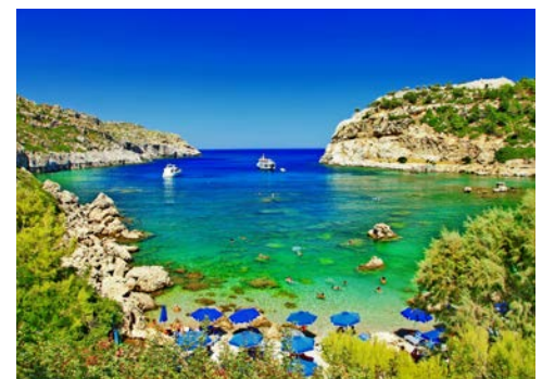
Traumhafte Buchten finden Sie auf Rhodos