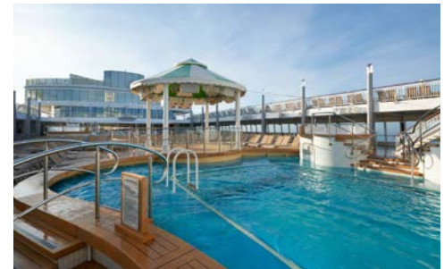
Pooldeck der NORWEGIAN JADE

Gesundheitshinweise: Sämtliche Informationen und Hinweise erhalten Sie im Internet unter der unten angegebenen Adresse.