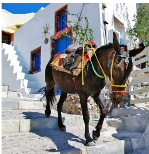
Auf Santorin begegnen Ihnen Esel

mit traumhaften Buchten, die zum Baden einladen. Aber auch kulturell hat Rhodos einiges zu bieten, zum Beispiel die Altstadt von Rhodos Stadt mit ihren mächtigen Stadtmauern und dem imposanten Großmeisterpalast.