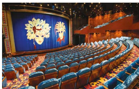
Das Stardust Theater

Trinkgelder an Bord: Die gesamte Besatzung der Norwegian Cruise Line ist jederzeit bestrebt, Ihnen den ausgezeichneten Servicestandard an Bord zu bieten, für den NCL bekannt ist. Eine Honorierung der exzellenten Servicequalität ist wünschens- und empfehlenswert. Norwegian Cruise Line spricht je nach Schiff und Kabinenkategorie Empfehlungen für alle Gäste ab 3 Jahre zwischen USD 15,- und USD 23,50 aus. Selbstverständlich obliegt die Entscheidung des Trinkgeldes Ihnen. So können Sie am Ende der Reise entscheiden, wie zufrieden Sie mit dem Service an Bord waren. NCL stellt Ihnen im Rahmen der Endabrechnung Ihres Bordkontos die Optionen frei, die Trinkgeld-Empfehlung zu bestätigen, verfallen zu lassen oder einen von Ihnen gewünschten Trinkgeldbetrag abbuchen zu lassen. Bei weiteren Fragen beraten wir Sie gern.