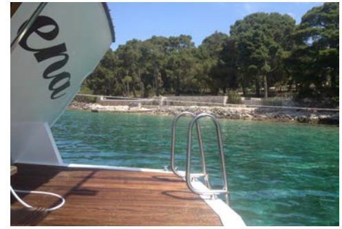
Die Badeplattform der MORENA

Mindestteilnehmerzahl für die durch uns zusammengestellte Gruppe: 30 Personen (bei Nichterreichen bis 4 Wochen vor Reiseantritt sind wir berechtigt, vom Reisevertrag zurückzutreten. Bei Absage erhalten Sie ein Ersatzangebot oder den gezahlten Reisepreis unverzüglich zurück).