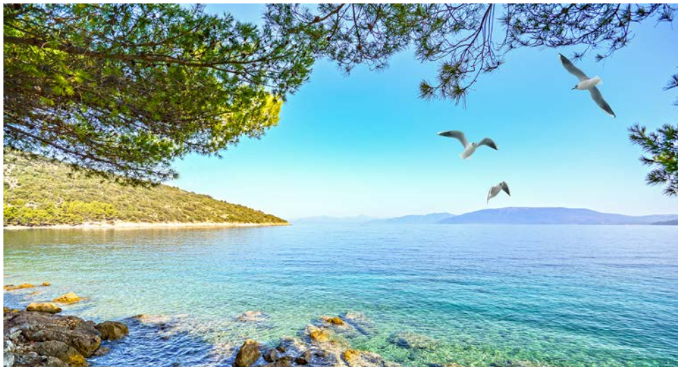
Glasklares Wasser lädt zum Baden ein

Landschaft der Insel. Bewundern Sie im Ort Lun die 1.000 Jahre alten Olivenbäume, die oft von selbst-aufgeschütteten Steinmauern der Inselbewohner geschützt werden. Auf Ihrer Tour sollten Sie stets die Augen offen halten, da nicht selten ein Schaf vor Ihr Rad laufen könnte. In Novalja haben Sie die Möglichkeit, wieder an Bord der MORENA zu gehen. Wer Lust hat weiter zu radeln, ist herzlich eingeladen, an dem weiteren Streckenverlauf bis nach Mandre teilzunehmen. Im Idyllischen Mandre geht es zurück aufs Schiff, welches Sie dann zur Insel Ilovik bringen wird. Übernachtung und Abendessen (Kapitänsdinner) an Bord.