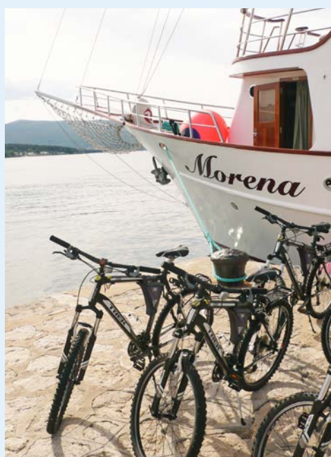
Die Räder stehen für Ihre Radtour bereit