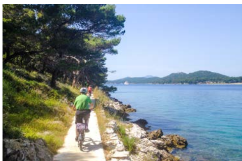
Einfach herrlich, das Radeln direkt am Wasser

Landschaft der Insel. Bewundern Sie im Ort Lun die 1.000 Jahre alten Olivenbäume, die oft von selbst-aufgeschütteten Steinmauern der Inselbewohner geschützt werden. Auf Ihrer Tour sollten Sie stets die Augen offen halten, da nicht selten ein Schaf vor Ihr Rad laufen könnte. In Novalja haben Sie die Möglichkeit, wieder an Bord der MORENA zu gehen. Wer Lust hat weiter zu radeln, ist herzlich eingeladen, an dem weiteren Streckenverlauf bis nach Mandre teilzunehmen. Im Idyllischen Mandre geht es zurück aufs Schiff, welches Sie dann zur Insel Ilovik bringen wird. Übernachtung und Abendessen (Kapitänsdinner) an Bord.