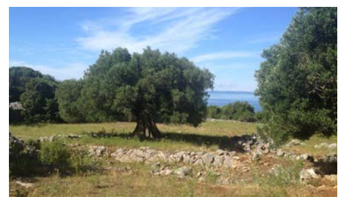
Entlang alter Olivenhaine, das Meer im Blick

Nach einer kurzen Überfahrt zur Insel Pag starten Sie Ihren Fahrradausflug durch die wunderschöne